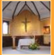
Chapelle de Fleur des Neiges

C'est dans cette dynamique que s'inscrit l'esprit de « Fleur des Neiges », Centre animé par des Religieuses et Amis de l'Assomption