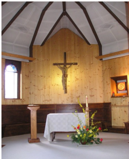
Chapelle de Fleur des Neiges

... et nous ouvre au sens de la prière et de l'agir au cœur des réalités du monde.