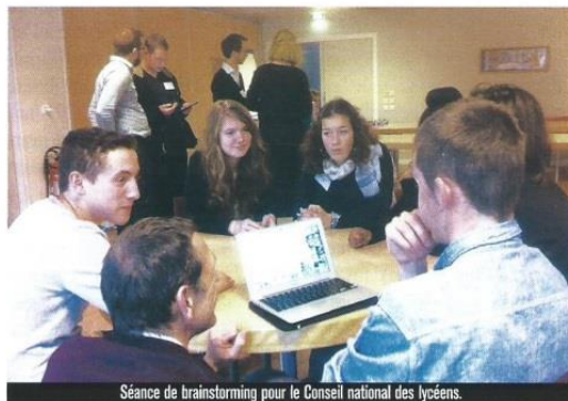
Séance de brainstorming pour le Conseil national des lycéens.